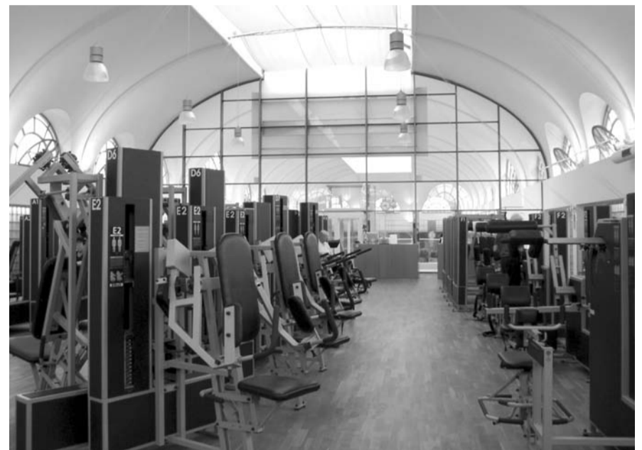
Kieser Training im komplett sanierten Ostteil: Erst ein architektonisches Erlebnis, dann konzentriertes Training im historischen Ambiente