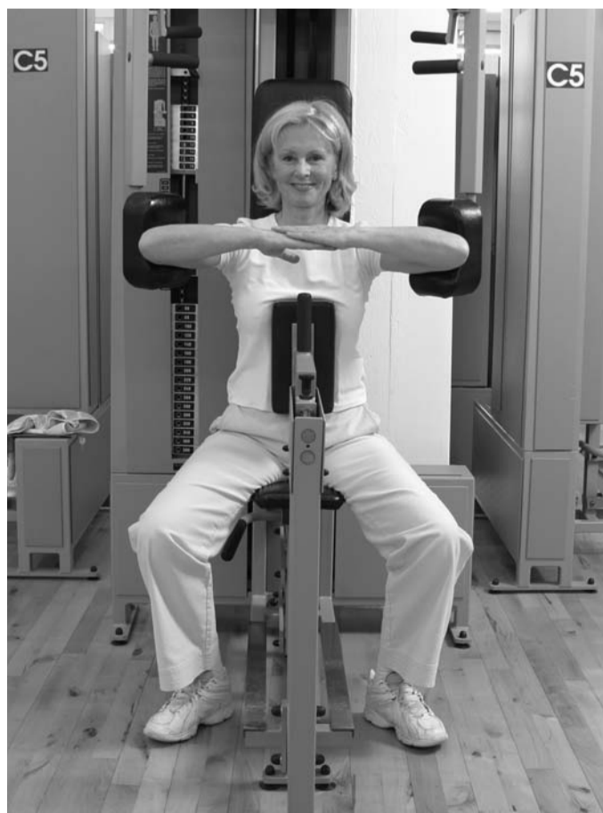
Training an der C5

Führt man die Ellenbogen weit nach hinten, werden gleichzeitig die Brust- und die vordere Schultermuskulatur gedehnt. Letzteres ist bei Haltungsschwächen von besonderer Bedeutung, denn im Verhältnis zur abgeschwächten Rückenmuskulatur ist diese häufig zu kräftig und verkürzt. Dieses Kräfteungleichgewicht, auch als muskuläre Dysbalance bezeichnet, wird durch das Training an der C5 korrigiert.