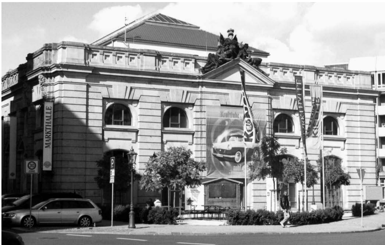
Training im denkmalgeschützten Gründerzeitgebäude: Seit 2001 findet sich Kieser Training Dresden-Neustadt in der sanierten Markthalle von 1899.

Kieser Training Dresden liegt in einer der schönsten Markthallen der Gründerzeit in Deutschland