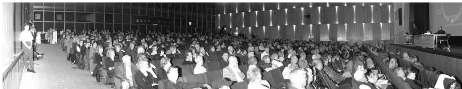
Die Vorträge auf dem diesjährigen Gesundheitstag in der Urania Berlin lockten viele Interessenten.