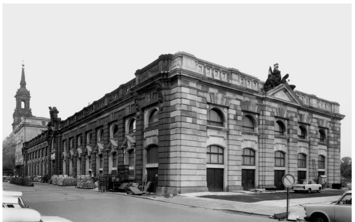
Der im Zweiten Weltkrieg zerstörte Ostteil wurde in den 80er Jahren wieder aufgebaut. Foto: Dresden SLUB/Deutsche Fotothek, Stellmacher/Martin, 1988